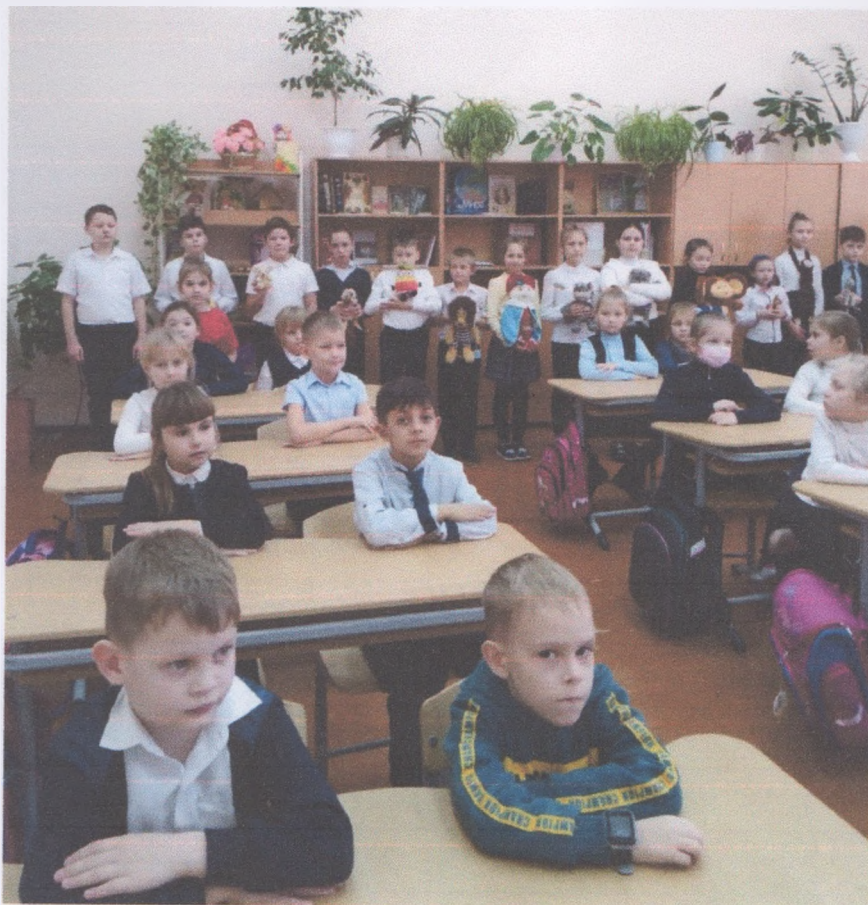
Приложение 1. Беседа на тему: «Как мультфильмы влияют на ребёнка»